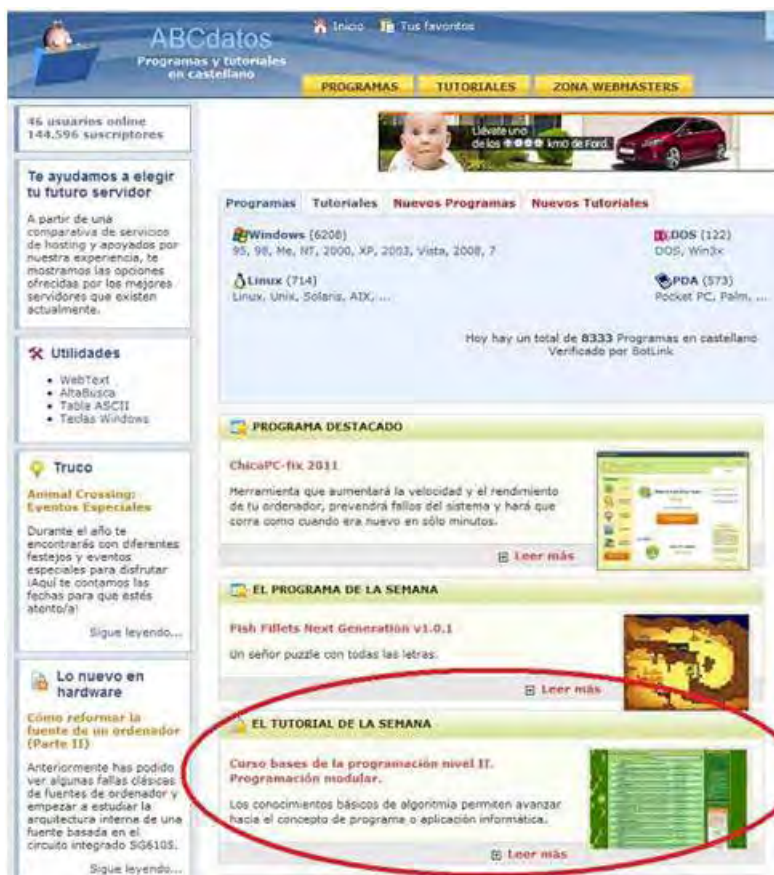
Los tutoriales de aprenderaprogramar.com, destacados en portada.